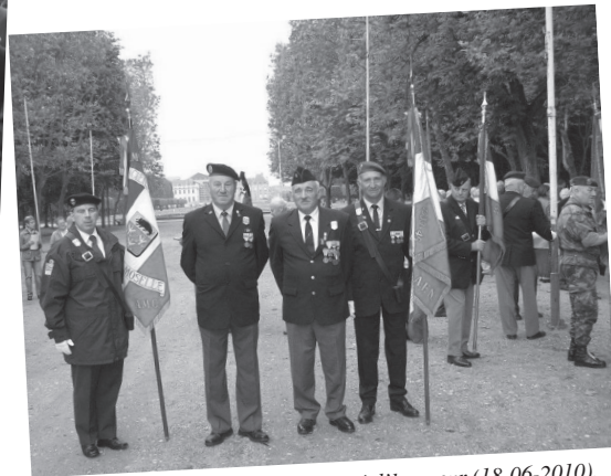
La section AMC Avricourt-Blâmont à l'honneur (18-06-2010).